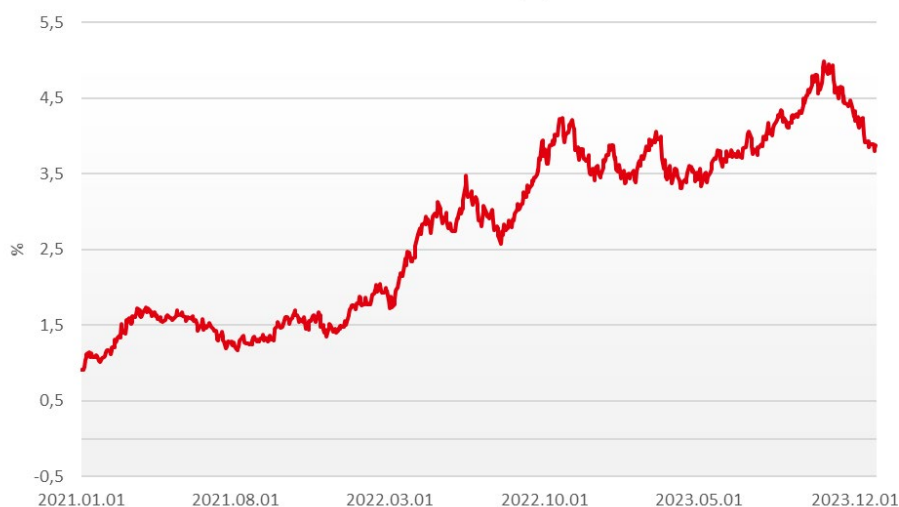
A 10 éves amerikai állampapírhozam